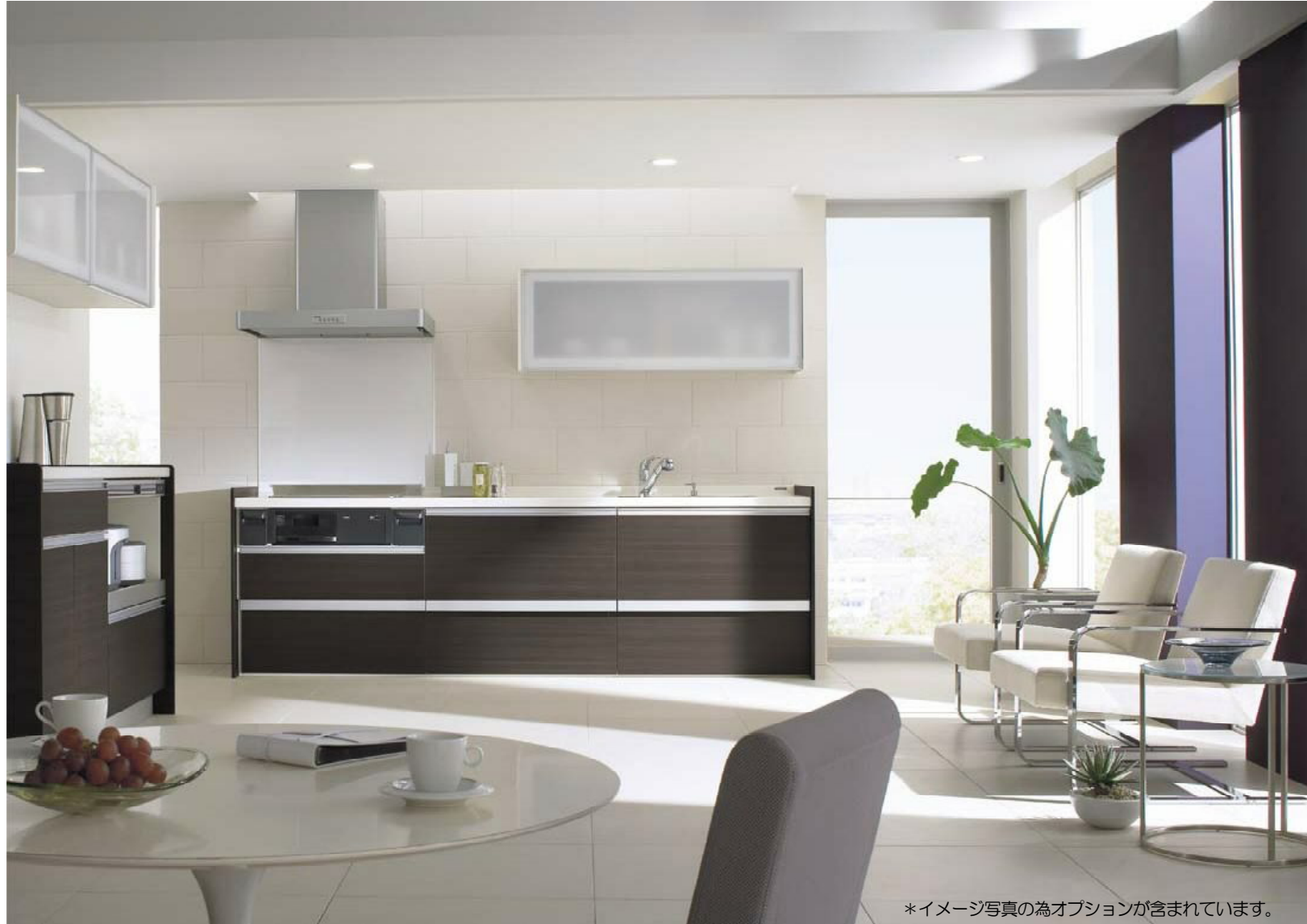
*イメージ写真の為オプションが含まれています。