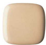
#SC4 ハーベストベージュ