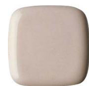
#SS4 ハーベストブラウン