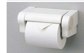
棚付二連紙巻器 YH52R※ (本体カラー:ホワイト)