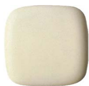
#SC1 パステルアイボリー