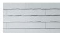
CC225* (STK760) シルバー・ホワイト