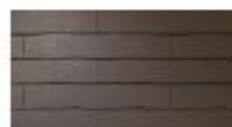
CC241* (STK210) ウォールナット・ブラウン