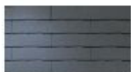
CC262* (STK620) ネオ・ブラック