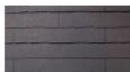
CC221* (STK210) ココナッツ・ブラウン