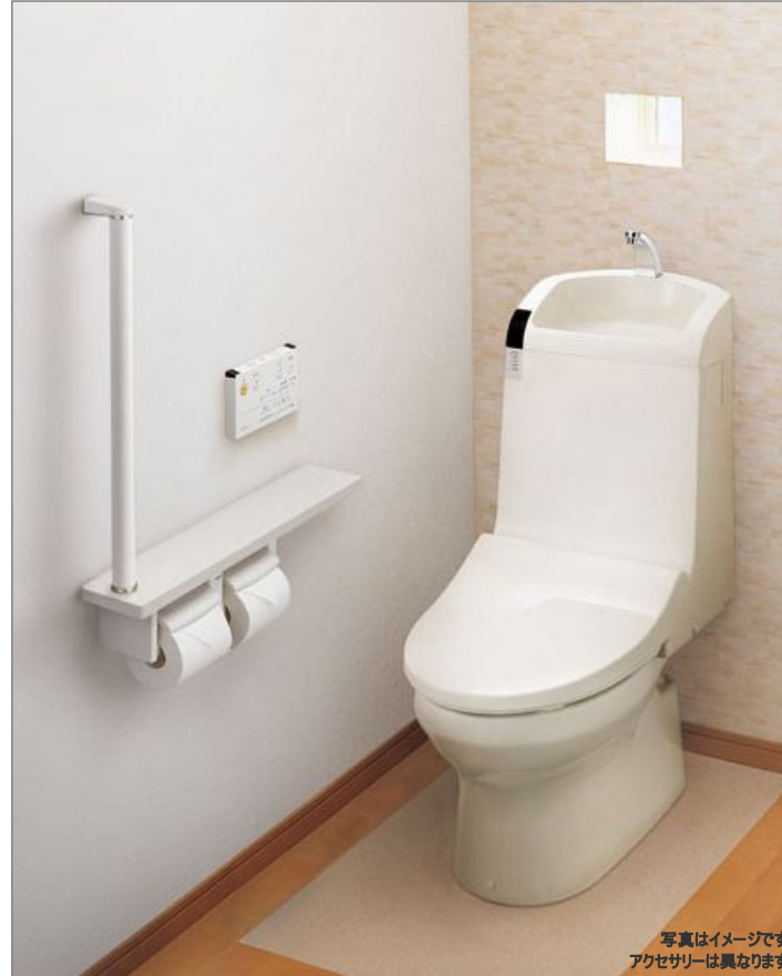
写真はイメージです アクセサリは異なります